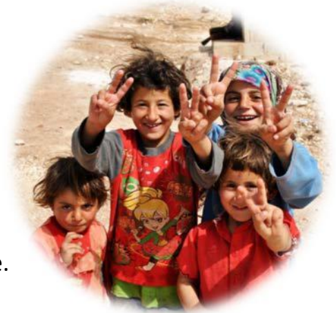
camp Atmeh, en Syrie, 2013