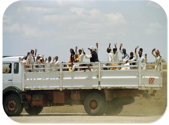
Des réfugiés érythréens au retour du Soudan

Le HCR travaille avec les gouvernements afin d'offrir les solutions durables aux réfugiés.